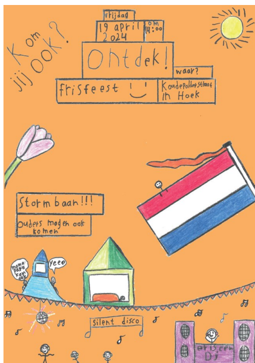
Poster ontworpen door Maud Dekker groep 8